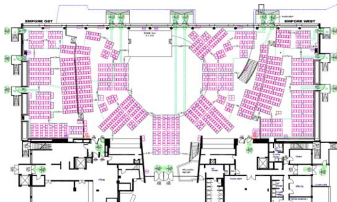
Grundriss EG Plan 09 – Floor plan ground floor # 09

*) Personalkosten für Auf- und Abbau und Betrieb während der Veranstaltung der Einrichtungen siehe Punkt 2 der Preisliste.